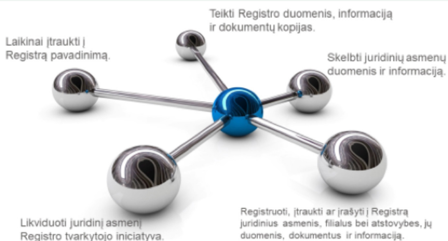
4 pav. Svarbiausios Registrų centro funkcijos tvarkant Juridinių asmenų registrą