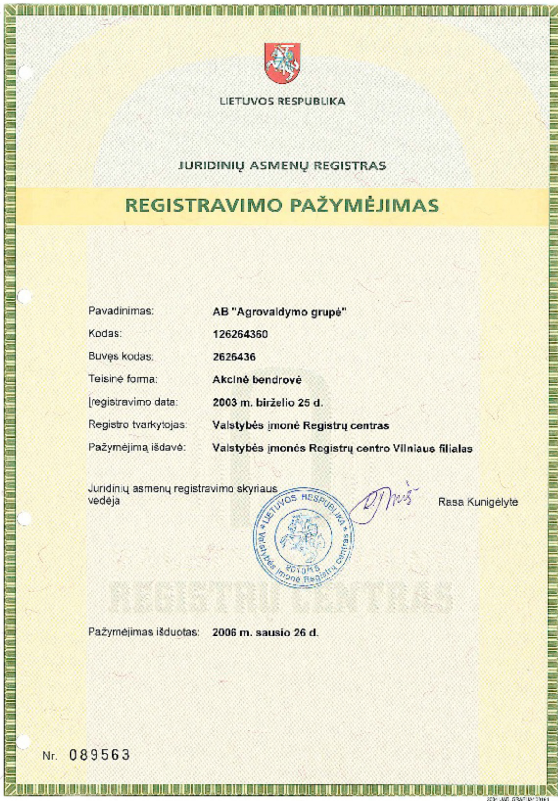
3 pav. Juridinių asmenų registre įregistruoto juridinio asmens pažymėjimas

Nuo Juridinių asmenų registro veiklos pradžios atsirado daugiau galimybių rinktis juridinio asmens pavadinimą, kuris būtų unikalus, t. y. nebūtų tapatus jau įregistruotų juridinių asmenų pavadinimams ir geriausiai atspindėtų juridinio asmens poreikius bei atitiktų teisės aktų nuostatas. Juridinio asmens pavadinimo atitikties įstatymų